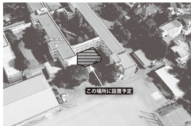
「翠翔みらい館」設置予定場所