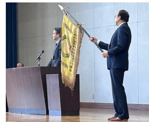
平翠戦・翠平戦クロージングセレモニー 於：平沼高校体育館 2025年12月19日（金）

2年間にわたる両校創立記念事業として行われ た「翠嵐平沼スポーツ・文化交流事業は無事 終了した