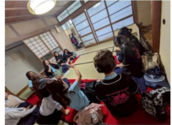
令和7年度ルーズベルト校受入

■ 全日制、定時制生徒の対外活動での活躍を横断幕でお祝いし、卒業記念品としてクリアファイル、定時制卒業証書入れを贈呈した