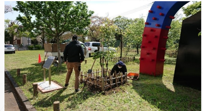
専門家による桜木の維持管理