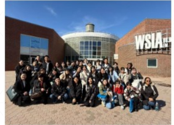
令和7年度ルーズベルト校訪問 翠嵐高校ホームページより

両事業は国内外の物価、渡航費急騰、米国規定変更による付き添い教員数の増加等により予算不足の事態となっており、訪問事業は金銭的な理由で応募を断念することが懸念されている